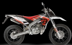
RX - ROT SPORT