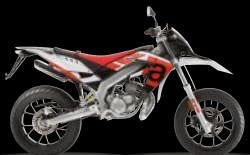
SX - ROT SPORT